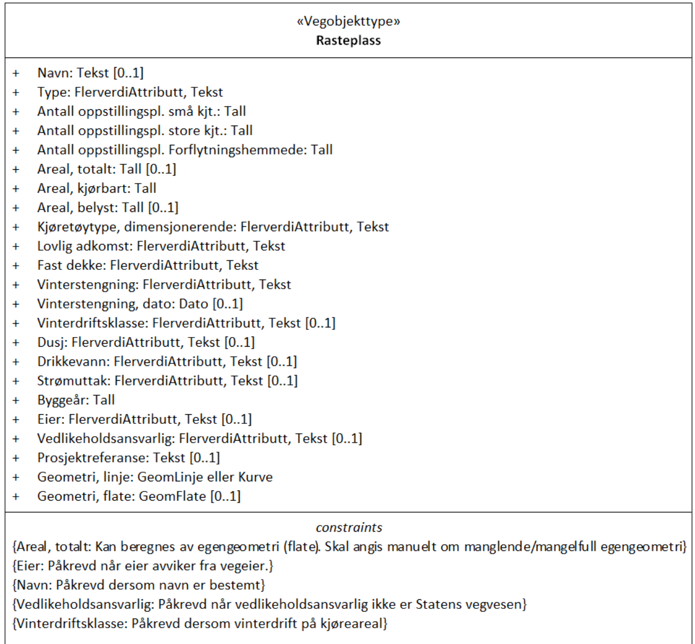
Figur 1: UML-skjema Rasteplass