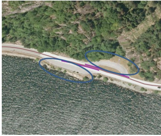
To rasteplasser ved siden av hverandre

Rasteplasser på hver side av vegen med egen innkjøring. Registreres som to rasteplasser