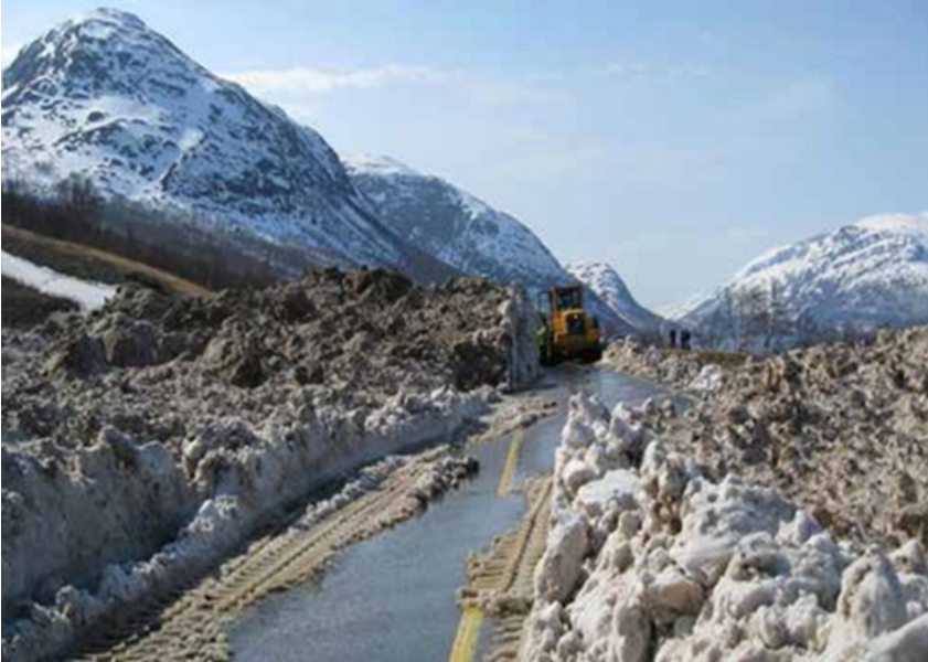
Sørpeskred, E6 Langfjorden, Finnmark, 16.05.2010 (Håndbok 139)

Vegreferanse: 1800 EV6 HP11 m13000 – 17120