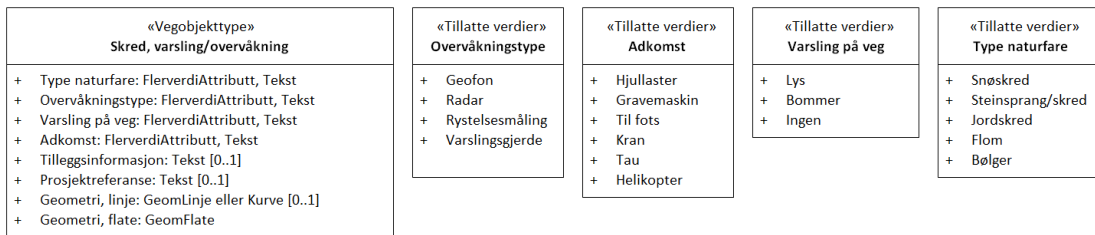
Figur 2: UML-skjema tillatte verdier