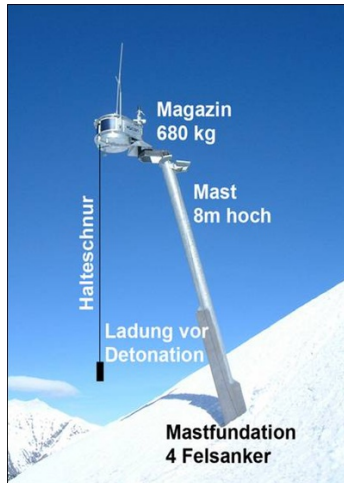
Figur 3: Skredutløsning med Wysstentårn.

Adkomst: Helikopter Antall enheter: 1 Byggeår: 2008 Type: Wysstentårn