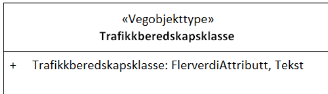
Figur 3: UML-skjema med assosiasjoner