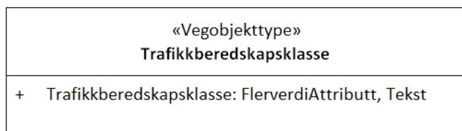
Figur 1:UML-skjema med betingelser