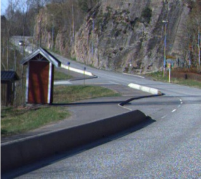
Eksempel 1. Trafikklorne - bruksområde busslomme

Bruksområde: Busslomme Trafikkdeler: Nei Belysning: Ja, belyst av gatebelysning Dekketype: Asfalt Lengde,full bredde: 20 meter Vinteråpen: Ja