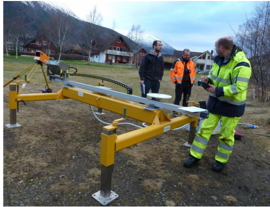
Figur 3: Utstyr for skredvarsling med radar

Eksemplet viser utstyr for skredvarsling basert på radar. Enheten har også tilknyttet GPS og laserscanner.