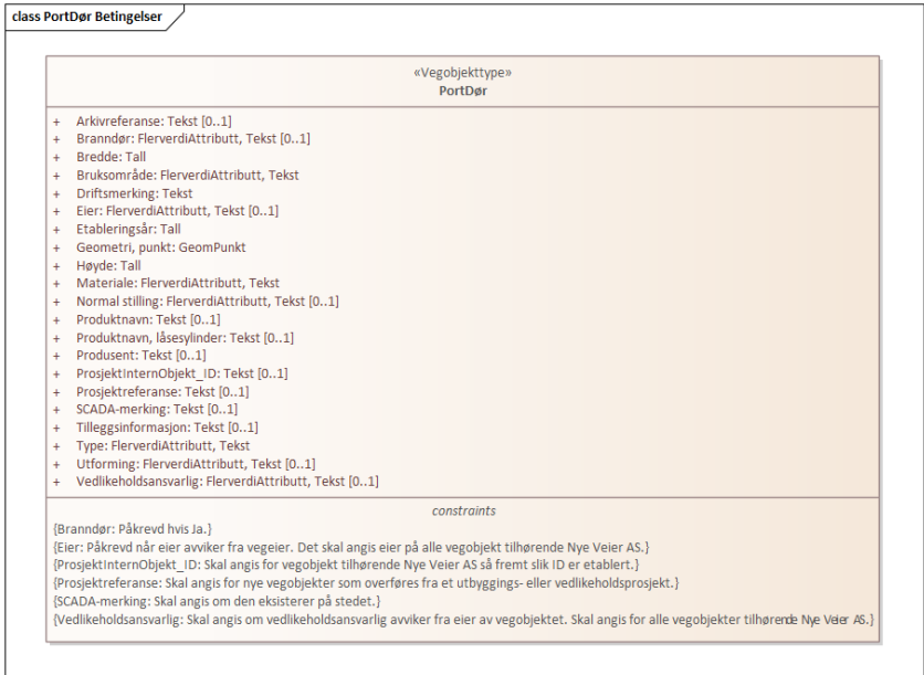
Figur 1: UML-skjema med betingelser