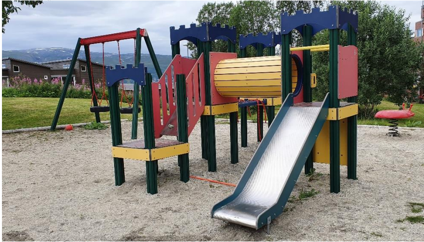
Figur 1 Lekeapparat