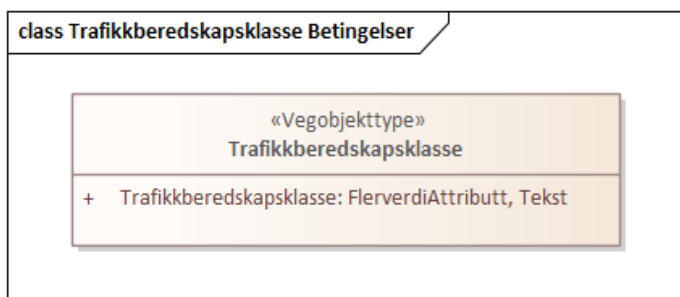
Figur 1:UML-skjema med betingelser